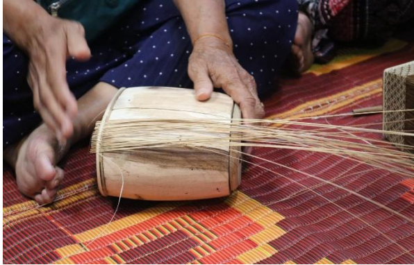
ภาพที่ 20 หวายที่เหลาแล้ว

1. นำไม้ไผ่มาเหลาให้เป็นก้านเล็ก ๆ แล้วนำมาชุบสีเพื่อใช้เป็นลวดลาย