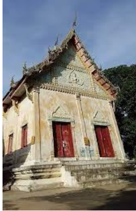
ภาพที่ 8 วัดข่อยสังฆาราม

วัดข่อยสังฆาราม ตั้งอยู่เลขที่ 13 ตำบลหัวไผ่ อำเภอเมืองสิงห์บุรี จังหวัดสิงห์บุรี สังกัดคณะสงฆ์มหานิกาย ที่ดินที่ตั้งวัดมีเนื้อที่ 24 ไร่ มีอุโบสถ กว้าง 40 เมตร ยาว 80 เมตร สร้างเมื่อ พ.ศ. 2530 เป็นอาคารคอนกรีตเสริมเหล็ก มีศาลาการเปรียญ กว้าง 10 เมตร ยาว 32 เมตร สร้างเมื่อ พ.ศ. 2529 เป็นอาคารคอนกรีตเสริมเหล็ก 2 ชั้น กุฏิสงฆ์ จำนวน 18 หลัง เป็นอาคารไม้ 5 หลัง ครึ่งปูนครึ่งไม้ 6 หลัง อาคารคอนกรีตเสริมเหล็ก 1 หลัง ศาลาบำเพ็ญกุศล จำนวน 1 หลัง สร้างด้วยคอนกรีตเสริมเหล็ก 1 หลัง นอกจากนี้ มีฌาปนสถาน 1 หลัง เรือนเก็บพัสดุ 1 หลัง วัดข่อยสังฆาราม ตั้งเมื่อ พ.ศ. 2340 ชาวบ้านเรียกสั้นๆ ว่าวัดข่อย ต่อมาได้มีนายโพธิ์ นางขาว ผลิอรุณ และนายอู่ นางเป้า ผลิอรุณ บริจาคที่ดินที่ติดต่อกับที่วัดเพิ่มเติมและเปลี่ยนชื่อเป็น "วัดข่อยสังฆาราม" ได้รับพระราชทานวิสุงคามสีมาเมื่อวันที่ 2 กุมภาพันธ์ พ.ศ. 2538 เขตวิสุงคามสีมา กว้าง 40 เมตร ยาว 80 เมตร การบริหารและการปกครอง มีเจ้าอาวาสรูปปัจจุบันคือ พระอธิการชะลอ ชลปญโญ