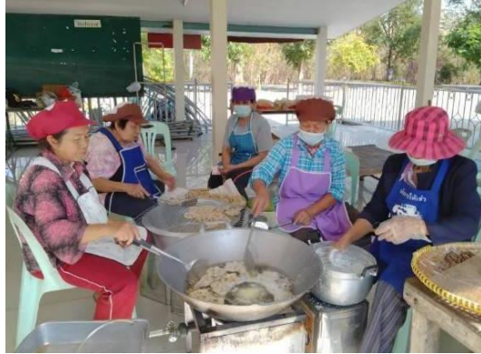
ภาพที่ 13 การศึกษาการทำขนมกง