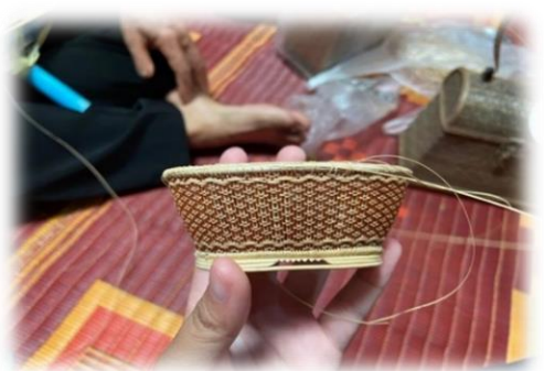
ภาพที่ 19 การศึกษาการจักสานตะกร้า ณ บ้านหัวไผ่