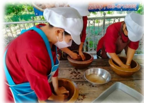
ภาพที่ 12 การปั้นส่วนผสมขนมกง