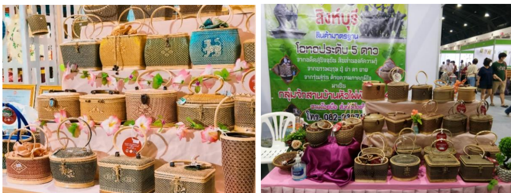
ภาพที่ 15 สินค้าจักสานบ้านหัวไผ่

โดยปัจจุบันมีสมาชิกที่เป็นกลุ่มคนผู้สูงอายุ และกลุ่มแม่บ้านที่ว่างเว้นจากการทำนา จึงมาทำงานรวมกลุ่มจักสานเป็นกระเปาะหูหิ้ว ซึ่งสามารถจำหน่ายใบละหลักร้อยหลักพัน โดยมีสมาชิกกลุ่มจักสานจำนวนทั้งหมด 12 คน มีการทำการจักสานอย่างสม่ำเสมอให้ได้คนละ 1 - 2 ชิ้นต่อเดือน โดยส่วนใหญ่เน้นการจักสานในรูปแบบ ลวดลาย และสีสันทันแบบเดิม เช่น 1) ตะกร้า