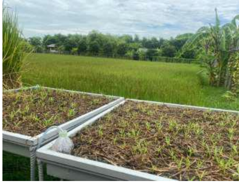
ภาพที่ 28 การเพาะปลูก