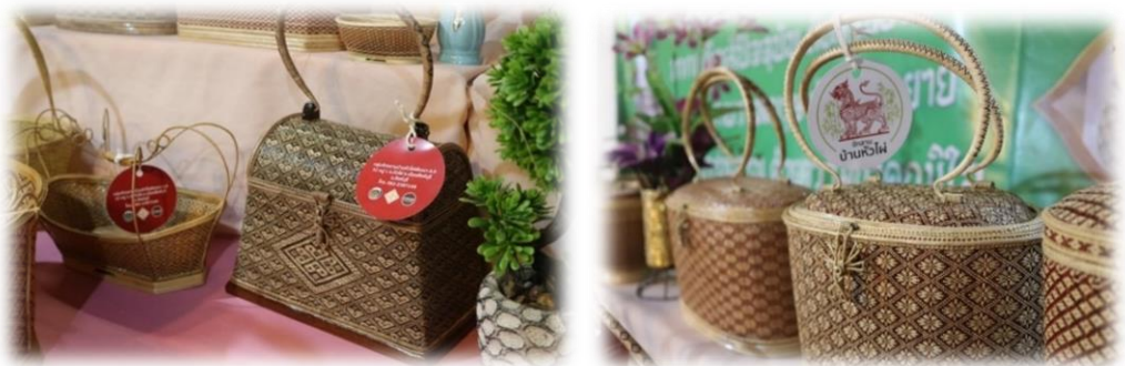
ภาพที่ 17 สินค้าจักสานกระเป๋