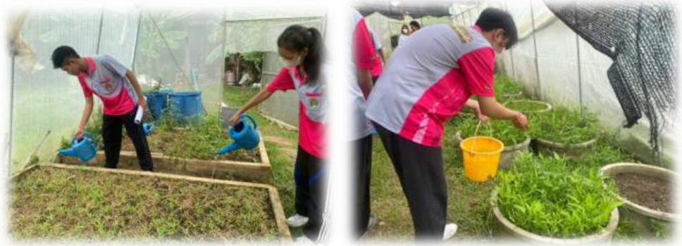
ภาพที่ 31 พืชผักสวนครัว