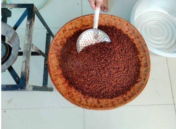
ภาพที่ 10 เมล็ดถั่วหลังนำไปตากแห้ง