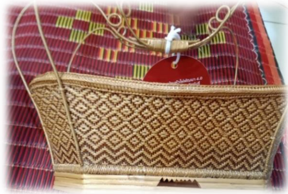
ภาพที่ 16 ตะกร้าชาแมงมุม

ชาแมงมุม ซึ่งเป็นรูปแบบตะกร้าทรงโบราณจากตำบลมหาสอน อำเภอบ้านหมี่ จังหวัดลพบุรี มีการพัฒนาให้มีสีสัน และลวดลาย ที่ทันสมัยมากขึ้น 2) ตะกร้าจักสานตามรูปแบบที่ชุมชนนำมา สอน และเผยแพร่ 3) ตะกร้าที่ออกแบบและพัฒนาารูปแบบ ลวดลาย สีสันให้แปลกตา และ ทันสมัย ให้ยังคงมีความสวยงามมากยิ่งขึ้น