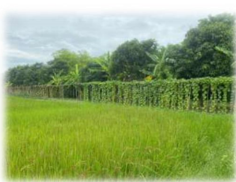
ภาพที่ 29 แปลงข้าวไรซ์เบอร์รี่