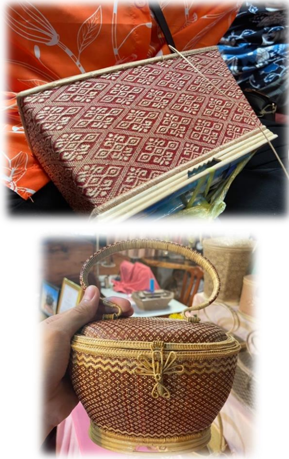
ภาพที่ 22 การศึกษาการจักรสานตะกร้า ณ บ้านหัวไผ่