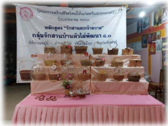
ภาพที่ 14 กลุ่มจักสานบ้านหัวไผ่