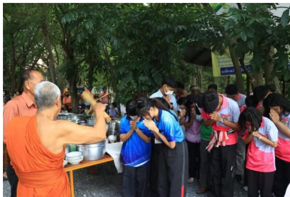
ภาพที่ 24 งานบรวงสรวง ณ วัดธรรมสังเวช

อยากทำไร่นาสวนผสมเกษตรอินทรีย์ ครอบคลุมตามแนวพระราชดำรินในหลวงใหม่ เด็กบางคนถามว่าเกษตรอินทรีย์ทำอะไร ก็บอกเด็กไปว่า ระบบการผลิต หรือการทำกินที่ไม่ทำลายสิ่งแวดล้อม รักษาความสมดุลของธรรมชาติ ไม่ใช่สารเคมี ไม่ใช่ปุ๋ยเคมี ใช้แต่ปุ๋ยหมัก มีใบไม้ใบหญ้าต่าง ๆ ซึ่งเป็นภูมิปัญญาของคนสมัยโบราณไม่มีสารพิษตกค้างกินแล้วอายุยืน ร่างกายแข็งแรง ลดรายจ่าย มีแต่รายได้ ดูแลสิ่งแวดล้อมด้วย เด็กบอกทำ จึงได้ตัดสินใจใช้ปัจจัยที่ชาวบ้านทำบุญ ตัดสินใจไปขอซื้อที่ดิน ของคุณทองหยด อินทฤทธิ์ ที่อยู่ติดหลังวัดจำนวน 8 ไร่ 2 งาน 04 ตารางวา รวมทั้งหมด 9 ไร่จัดแบ่งเนื้อที่ออกเป็นสวน ๆ ทำนาส่วนหนึ่งปลูกไม้ผลประจำฤดูส่วนหนึ่งมาใช้งานก่อสร้างส่วนหนึ่งไม้ล้มลุกทั้งเชิงตั้งเชิงเตี้ยตลอดจนพืชสมุนไพรที่สามารถนำมาใช้ได้ทั้งคนและสัตว์ตลอดจนพืชในไร่นาสวนผสมก็ได้ ต่อมาจึงได้จัดงานบรวงสรวง แห่ลงเรียนรู้เศรษฐกิจพอเพียง ณ วัดธรรมสังเวช เป็นพิธีที่ชาวบ้านจะบูชาสิ่งศักดิ์เจ้าที่เพื่อเป็นการขอบคุณที่ช่วยดูแล ปกป้องรักษา และคุ้มครองบริเวณวัดธรรมสังเวช และเพื่อเสริมสิริมงคลให้กับวัดธรรมสังเวช ชาวบ้าน พุทธศาสนิกชน ที่อาศัยอยู่ในตำบลหัวไผ่