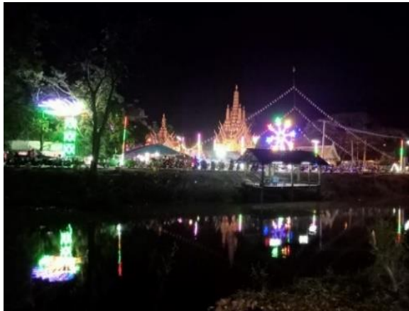
ภาพที่ 3 งานปิดทองฝังลูกนิมิต ณ วัดตะโหนด