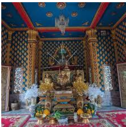
ภาพที่ 6 วัดโพธิ์ชัย