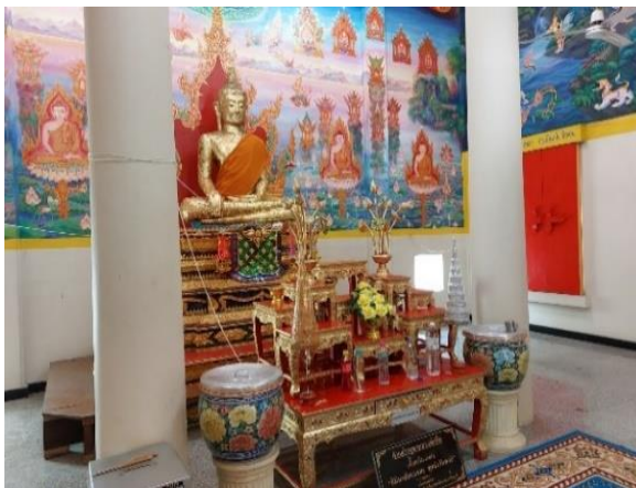
ภาพที่ 5 หลวงพ่อกิน ณ วัดธรรมสังเวช