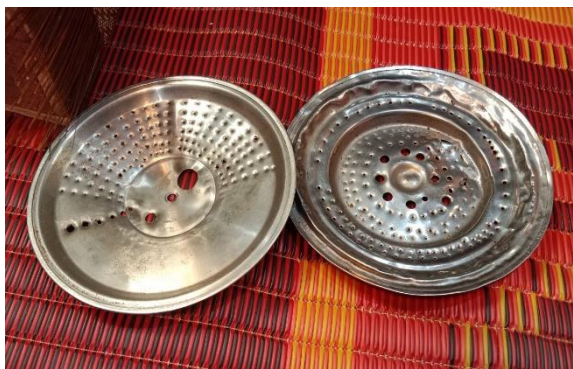
ภาพที่ 21 อุปกรณ์สำหรับเหลาหวายเรียกว่า “เลียด”

3. นำหวายมาเหลากับเลียด ให้เป็นเส้น เล็ก ๆ โดยเริ่มจากรูใหญ่ไล่มาจนถึงรูเล็ก ตามที่เราต้องการแล้วนำมาถักเข้ากับไม้ที่ขึ้นรูปเตรียมไว้ โดยกระเปาะที่ทำจากหวายนั่นอาจจะใช้ระยะเวลาประมาณ 1 เดือนหรือมากกว่านั้น ขึ้นอยู่กับลวดลายที่ทำ (สุนทร เหล่าเจริญ 2565)