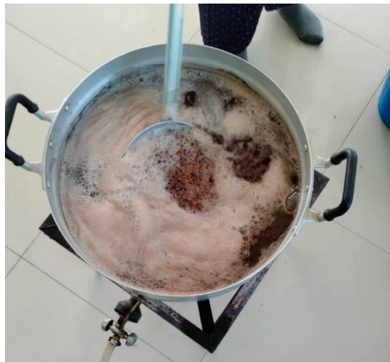
ภาพที่ 11 การผสมน้ำกะทิ น้ำตาลทราย และน้ำตาลปีบ