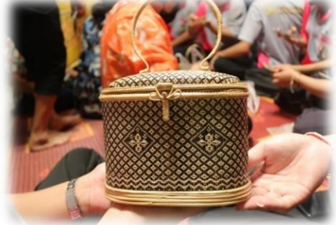
ภาพที่ 18 ตะกร้าจักสานลายดอกไม้