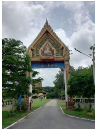
ภาพที่ 2 วัดตะโหนด