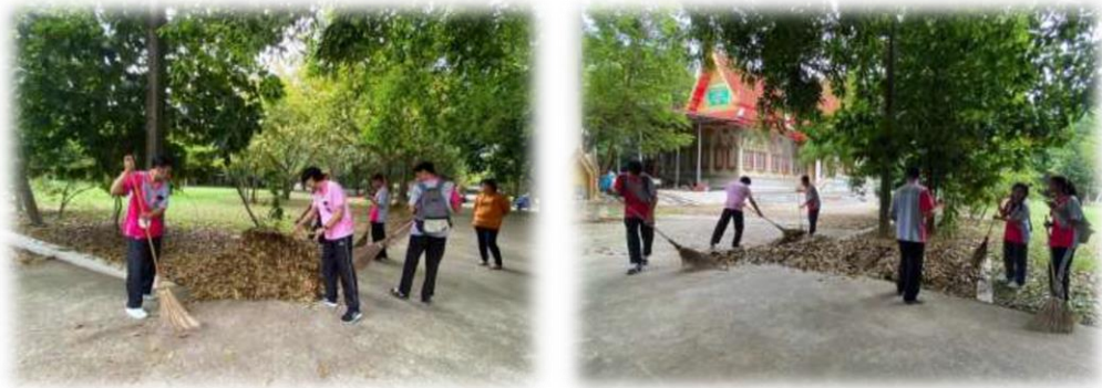
ภาพที่ 27 การกวาดใบไม้เพื่อนำไปทำปุ๋ยหมัก