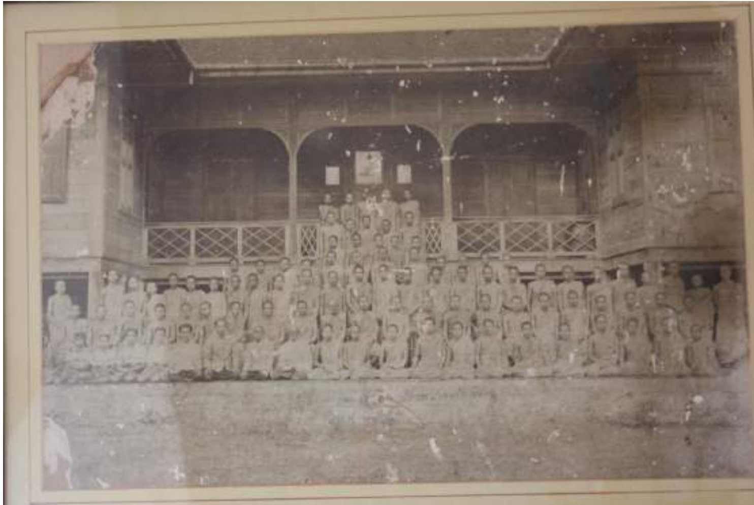
อาคารเรียนปริยัติธรรม