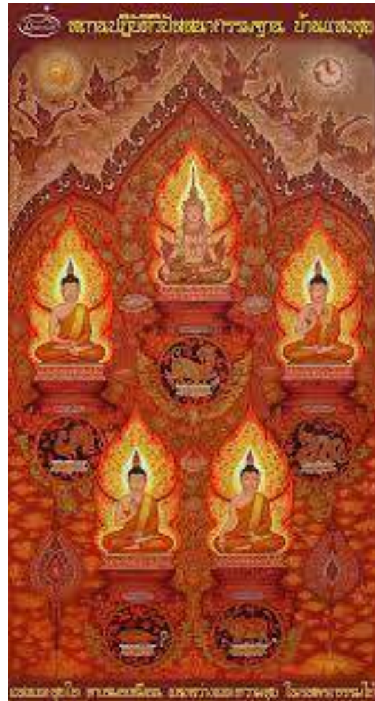
จัดแสดงพระศรีอาริย์เมตไตรย (พระพุทธเจ้าในอนาคต)